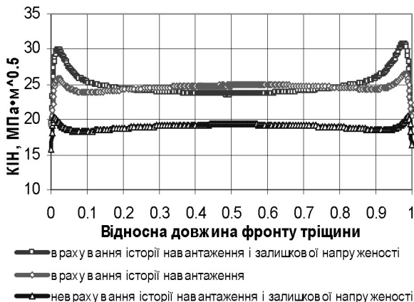
Рис. 3. Вплив історії навантаження на визначення КІН вздовж фронту для поверхневої колової тріщини у вузлі приварки для режиму нормальних умов експлуатації

Результати прикладних досліджень із застосуванням розроблених методів розрахунку відображені в публікаціях [1-16]. Для оцінки міцності і ресурсу корпусів реакторів ВВЕР у процесі експлуатації розроблено галузевий нормативний документ [17]. Створений спеціалізований програмний комплекс SPACE-RELAX пройшов всебічне тестування і дозволений до застосування в атомній галузі України відповідним розпорядженням експлуатувальної організації – НАЕК «Енергоатом».