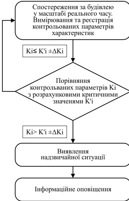
Рис. 1. Загальний алгоритм роботи автоматизованих систем моніторингу (АСМ) будівельних конструкцій

В складі СРВНСО роль джерел первинної інформації (ДПІ) відіграє автоматизований геодезичний комплекс, який під керуванням блоку управління (БУ) здійснює в безперервному режимі вимірювання на вихідні точки та точки спостереження. Первинними являються кути та відстані ( H_z , V , D ), що відповідають просторовому положенню точок спостереження та вихідних ( X , Y , Z ).